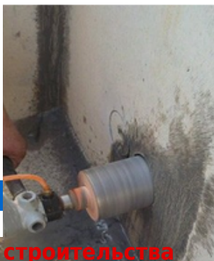
Diamond CNC drill bit

Boreway Machinery Co., Ltd. www.diamondtools.top www.boreway.com