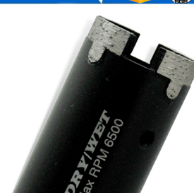
Diamond construction drill bit

Boreway Machinery Co., Ltd. www.diamondtools.top www.boreway.com