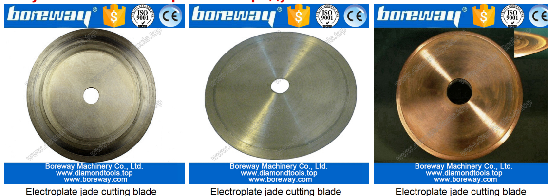
Electroplate jade cutting blade

Если вы не видите продукт, который вы хотите, пожалуйста, свяжитесь с нами для получения более изображений продукта.