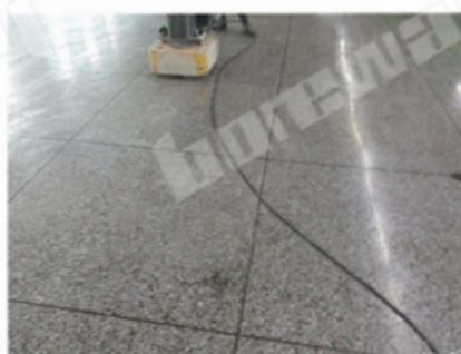
Before Grinding and Polishing