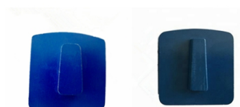
Husqvarna Redi Lock Blank Scanmaskin Blank

Заметка: Специальный логотип, размер сегмента и формы, установка доступны по запросу клиента.