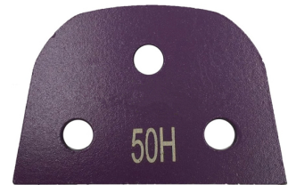
Lavina Blank with 3 Bare Holes