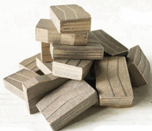
Granite Block Cutting Segment