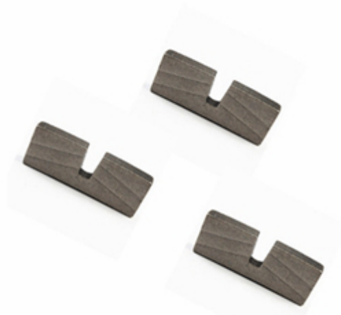
Granite Edge Cutting Segment