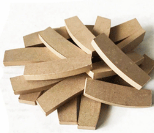
Marble Edge Cutting Segment