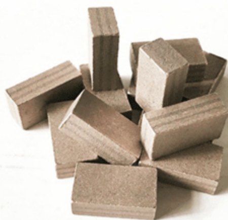
Marble Block Cutting Segment