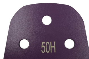
Lavina Blank with 3 Bare Holes