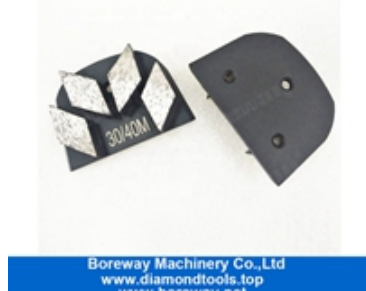
Шлифовальная обувь из четырех сегментов