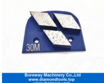
Шлифовальная обувь из трех сегментов