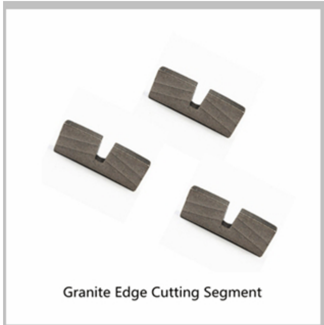
Granite Edge Cutting Segment