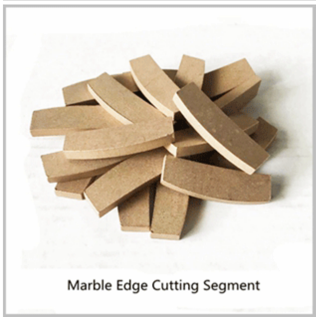
Marble Edge Cutting Segment