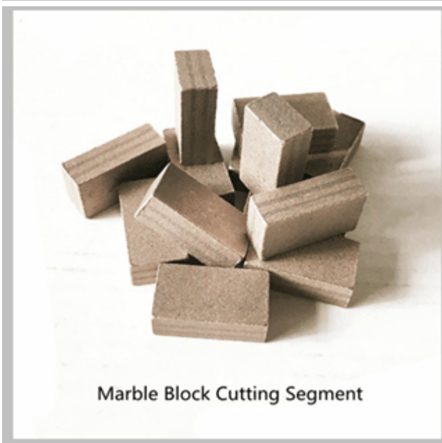
Marble Block Cutting Segment