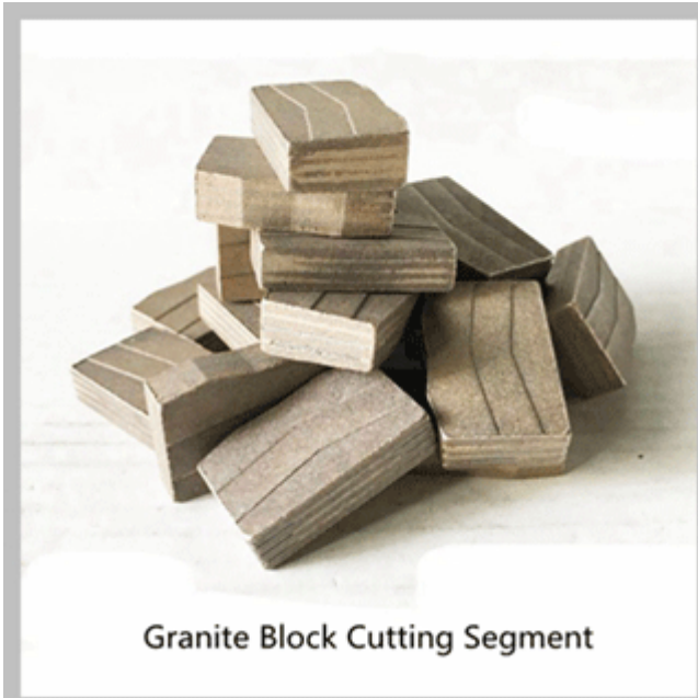
Granite Block Cutting Segment