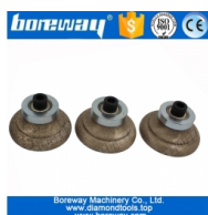
Непрерывная алмазная фреза O20xM10