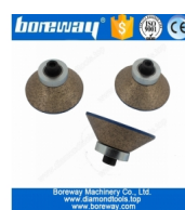
Металлические непрерывные алмазные фрезы