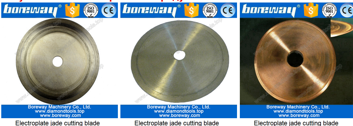
Electroplate jade cutting blade

Если вы не видите продукт, который вы хотите, пожалуйста, свяжитесь с нами для получения более изображений продукта.