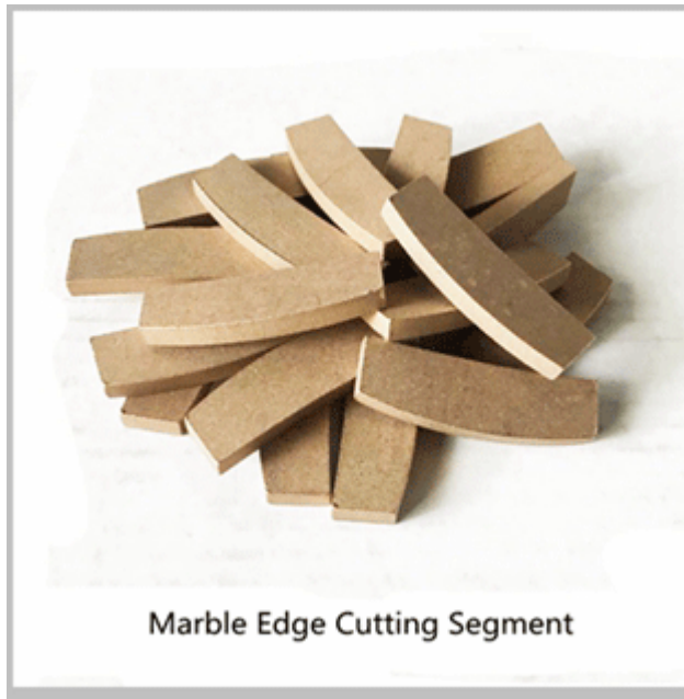
Marble Edge Cutting Segment