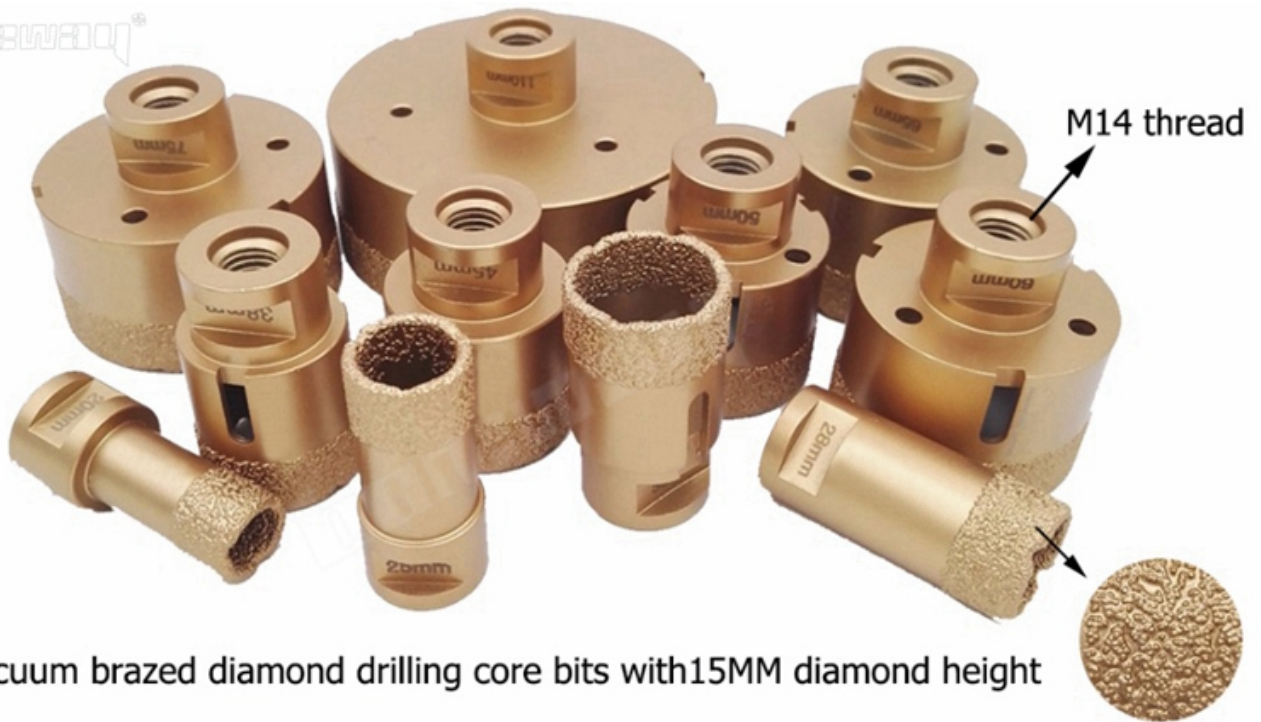
Vacuum brazed diamond drilling core bits with 15MM diamond height