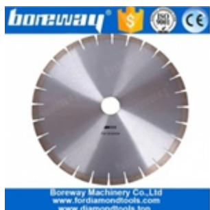
Гранитная пила 14 дюймов