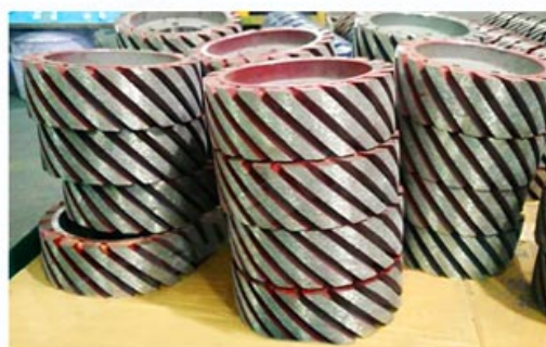
Diamond Satellite Wheel/ Rollers