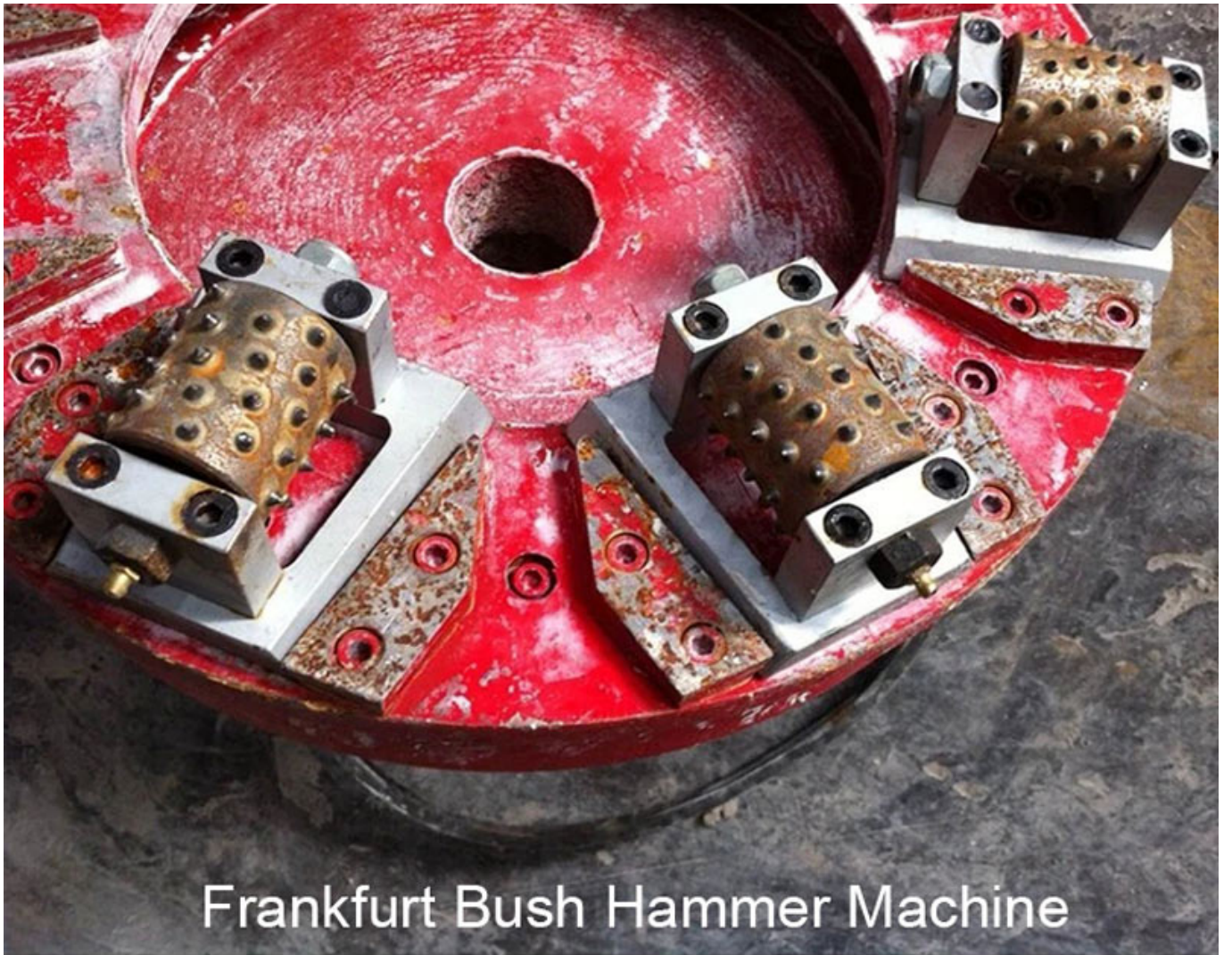
Frankfurt Bush Hammer Machine