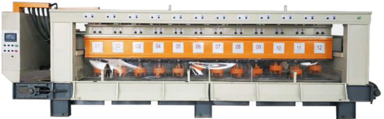
Automatic Bush Hammer Machine