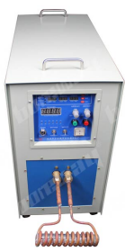
Three Phase 380V 30kW High Frequency Induction Welding Machine