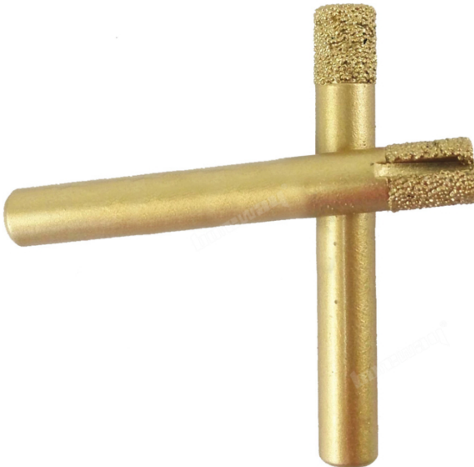
CNC Engraving Bit

Boreway Machinery Co., Ltd. www.diamondtools.top www.boreway.com