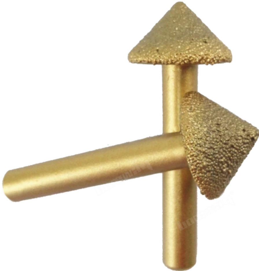
CNC Engraving Bit

Boreway Machinery Co., Ltd. www.diamondtools.top www.boreway.com