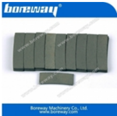
Кромко-режущий сегмент для гранита