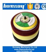
5-дюймовая пенная подушка