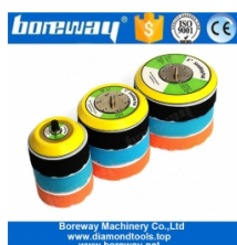
5/16 "-24 нить Vacker Pad