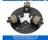
HTC 230 мм кустарника