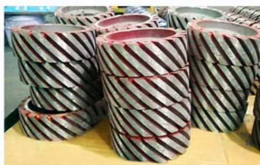
Diamond Satellite Wheel/ Rollers