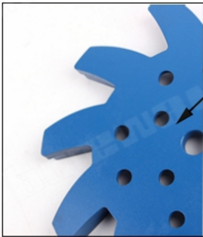
Quick Lock Connection Machine: General Grinding Machine