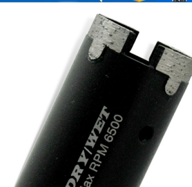
Diamond construction drill bit

Boreway Machinery Co., Ltd. www.diamondtools.top www.boreway.com