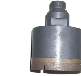
Diamond coring drill bit

Boreway Machinery Co., Ltd. www.diamondtools.top www.boreway.com