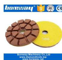
Resina diamante polimento almofadas