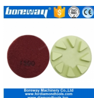
Almofadas de polimento de chão de diamante de 3 polegadas