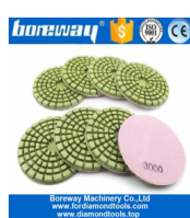
Resina Bond concreto almofadas de polimento de piso