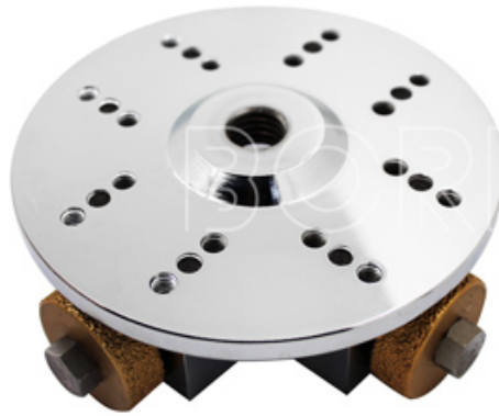
D125x4TxM14 Single Layer Plate