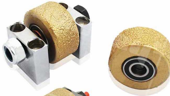
Frankfurt Bush Hammer Roller

Type: Abrasive Block Name: Vacuum Brazed Bush Hammer