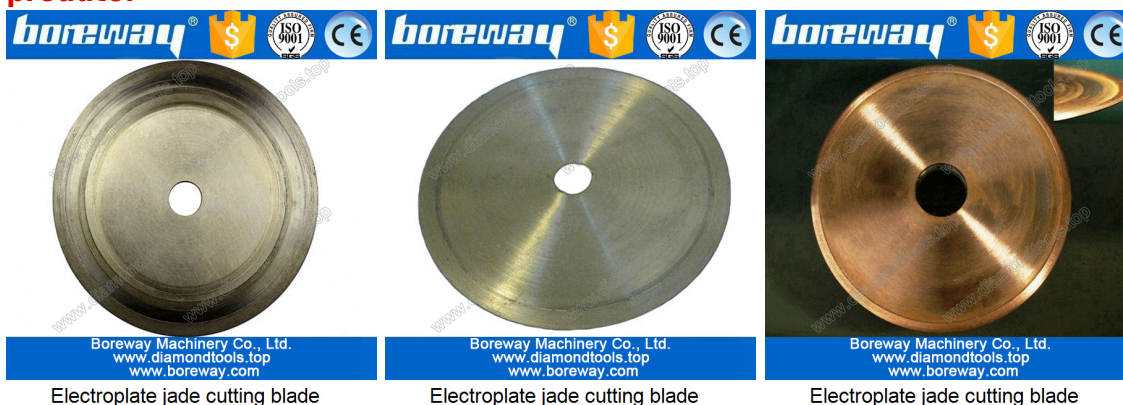
Electroplate jade cutting blade

Se você não vê o produto que deseja, entre em contato conosco para mais imagens do produto.