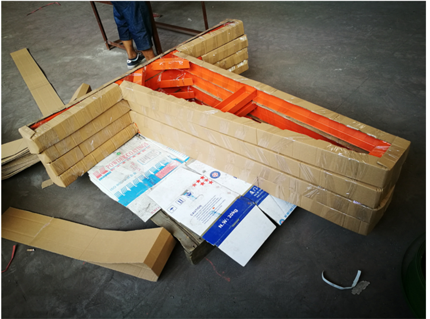
Embalagem & Entrega