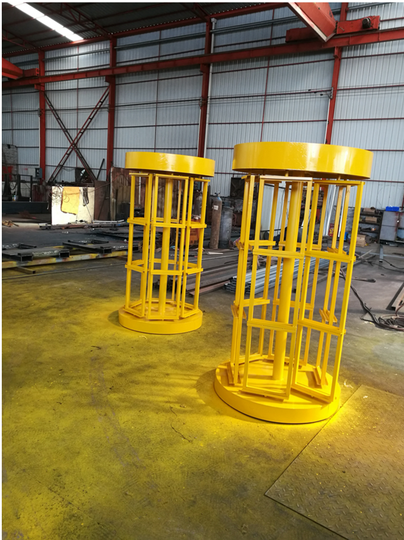
Embalagem & Entrega