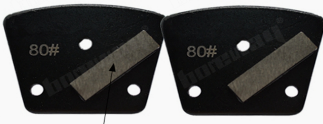
Size: 40*10*10mm*1T Single Bar Segment

Cabeça de moedura do diamante do trapézio do único segmento de barra para o assoalho do concreto e do terraço: