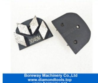
Sapatos de moagem de quatro segmentos