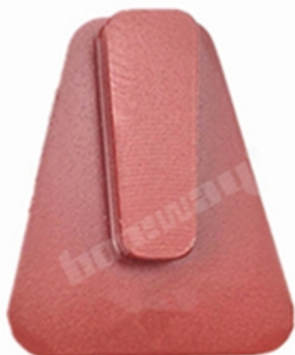
Husqvarna Redi Lock Blank