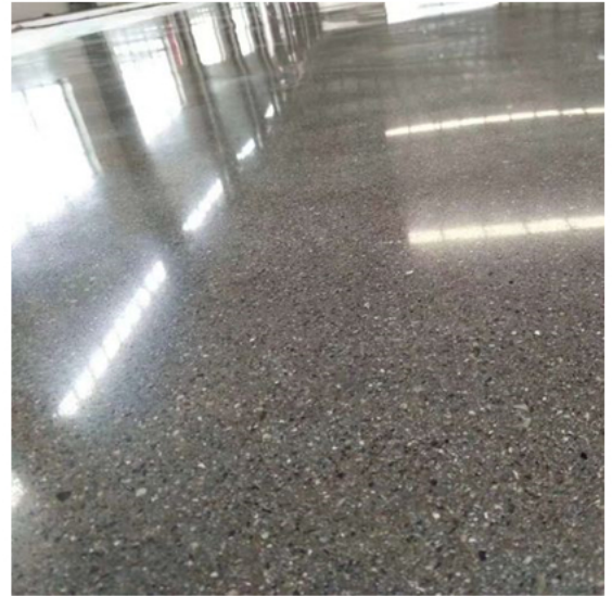
After Grinding and Polishing