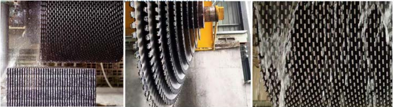
Multi blade block cutter (Single Size)