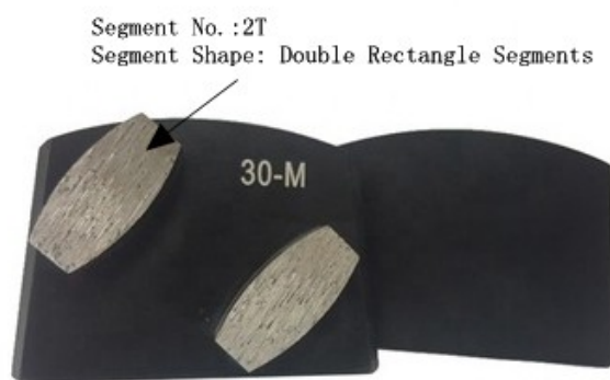
Lavina Grinding Shoe With Double Oval Segments

Se você está interessado em nossos produtos, pode clicar em mim.