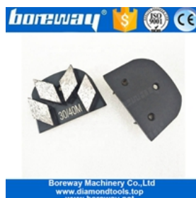
Quatro segmentos de moagem de sapatos