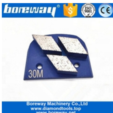
Três segmentos de moagem de sapatos