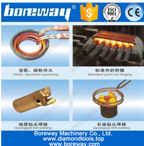
A variety of materials welding

Anexo: Interruptor de pé / interruptor da mão-imprensa, bobina de aquecimento (pode ser personalizado), tubulações de água, bombas de água (necessidade de comprar).