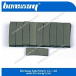
Segmento de corte de borda para granito