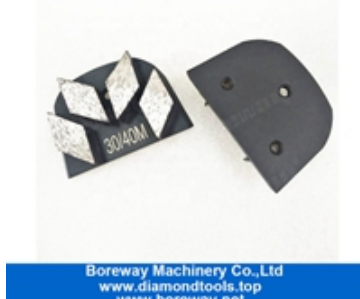
Quatro sapatos de moagem