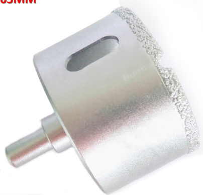
Vacuum brazed diamond core bits with round shank