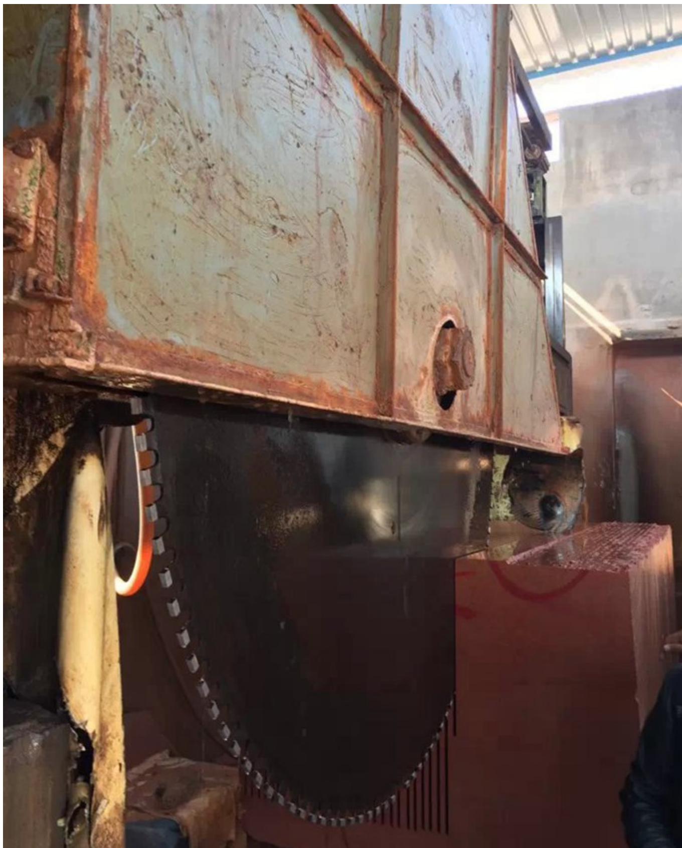
Efeito de corte: