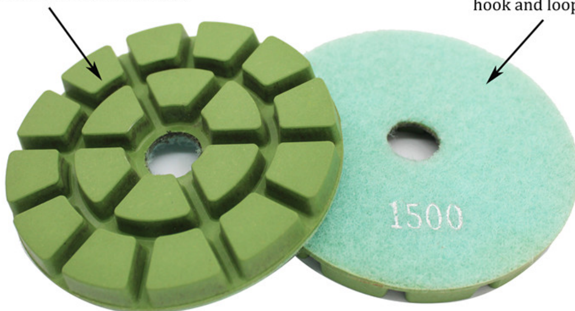
floor renew diamond polishing pads