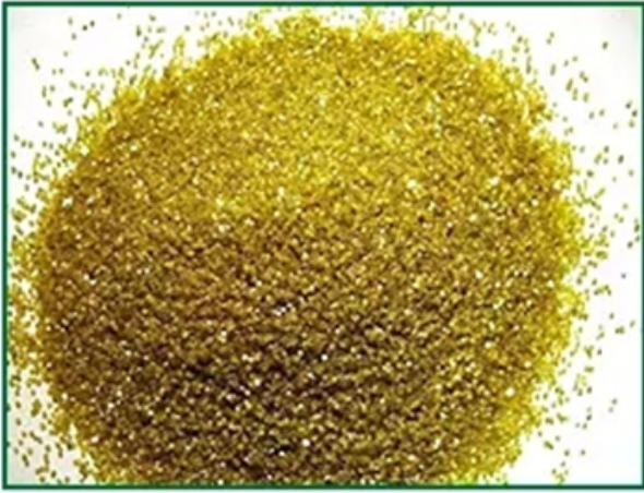
E6 diamond powder ,one of the best quality diamond powder in the world.