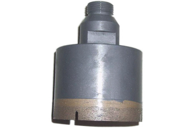
Diamond coring drill bit

Boreway Machinery Co., Ltd. www.diamondtools.top www.boreway.com