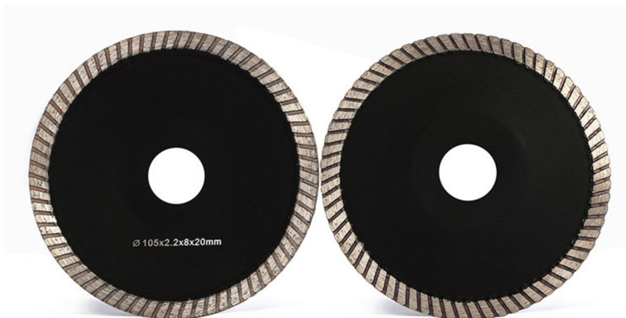
5 Inch Concave Diamond Cutting Blade