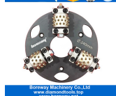
240mm buan martelo para moedor diamatic