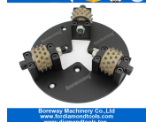
Roda de martelo de arbusto HTC 230mm